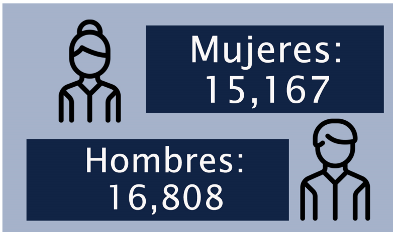
Gráfico elaboración propia de ORMUSA con datos tomados del sitio web oficial https://covid19.gob.sv/