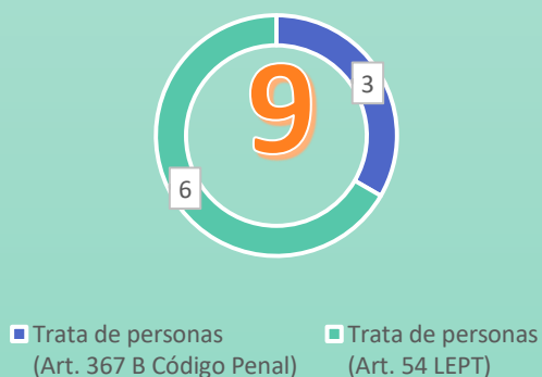
El salvador. Comparativo delitos de trata de personas, por mes (enero y febrero, 2021 - 2022)