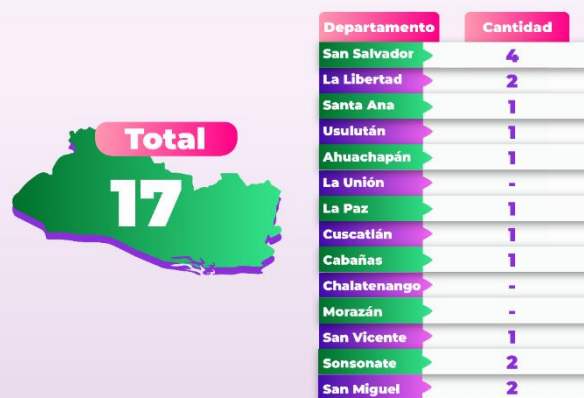
El Salvador. Feminicidios y muertes violentas de mujeres, desagregadas por departamentos. Período del 1 de enero al 30 de junio de 2024.